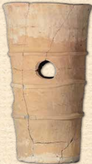
埴輪棺(塚山古墳群)