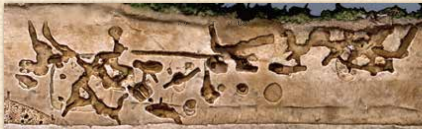
トンネル状遺構(新城遺跡)

本企画展は、近年県内で行われた発掘調査および整理作業の成果を、出土資料やパネルなどで紹介するものです。今回は以下の遺跡から出土した資料を展示しています。