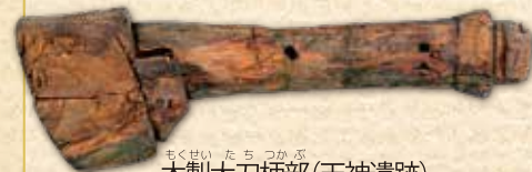
もくせいだちづかぶ 木製大刀柄部(天神遺跡) 所蔵：朽木県