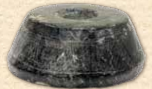
せきせいぼうすいしや 石製紡錘車(大関台遺跡) 所蔵：宇都宮市