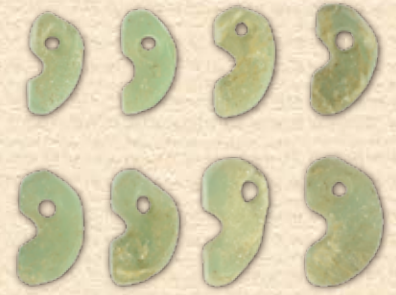
はんけつがたまがたま 半球形勾玉(町東遺跡) 所蔵：朽木県