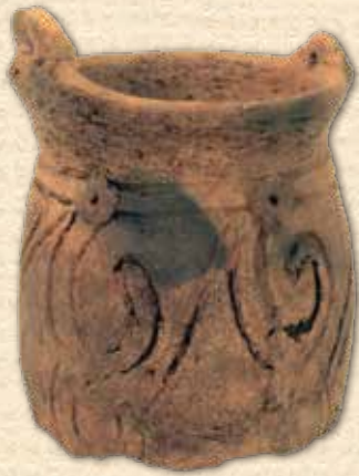
深鉢形土器(岩船台遺跡) 所蔵：大田原市